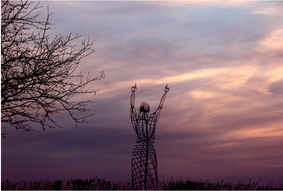
Am nördlichen Ortsausgang von Dormettingen steht die Stahlskulptur „Optimismus“ von Paul Weckenmann. Einen Steinwurf entfernt liegt das Gelände des ehemaligen KZ. Dort ist heute ein Steinbruch.

Militärfahrzeuge zu gewinnen und so noch einmal das Kriegsglück zu wenden. Am Bau der Produktionsanlagen waren Esten beteiligt, die Erfahrung mit Ölschiefer hatten. Saarländische Bergleute kümmerten sich um die Herrichtung der riesigen Wüste-Abbaufelder. Das Schwelverfahren, das hier eingesetzt wurde, war allerdings kein Musterbeispiel deutscher Ingenieurkunst. Die Ausbeute war so gering, dass ein Liter Schieferöl etwa das Sechzigfache des ursprünglichen Marktpreises kostete – trotz billigster Arbeitskräfte.